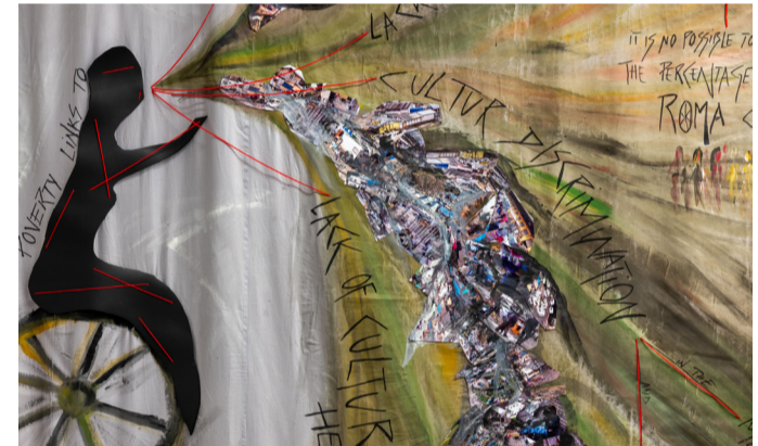
»Megaphone«, Luna De Rosa, Foto: © Jeremy Knowles