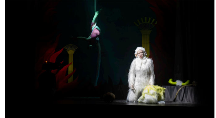
Musiktheaterwerkstatt, »Orfeo Ed Euridice«, Wintersemester 2023/24