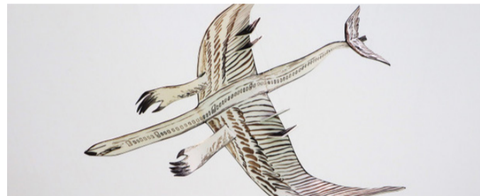
Semesterprojekt »Missing Love«, Wintersemester 2023/24

Treffpunkt: vor der Bibliothek (Haus C, EG)