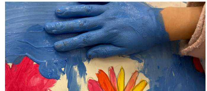
Ein Kind malt in der Kunsttherapie, Foto: © Uwe Herrmann