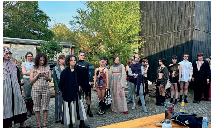
Backstage Studierendenshow, Frühling 2024, Foto: © Victoria Cravenco

Treffpunkt: Haus C, vor Raum C2.01 (2. OG)