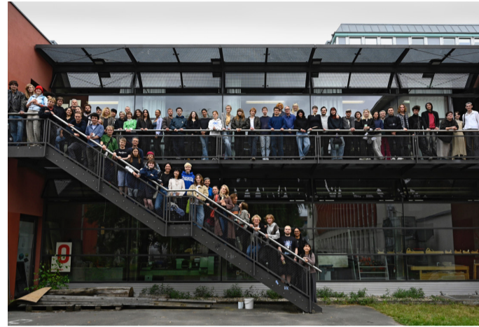
Grundlagen-Jahrgang 2023/24, Foto: © Heike Overberg

Treffpunkt: vor der Holzwerkstatt, Eingang zu H0.02