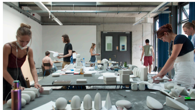
Plastisches Gestalten, 2. Semester Produkt-Design, Foto: © Ania Hrecka

Das Fachgebiet Produkt-Design bietet keine gesonderten Führungen an, in jedem Ausstellungsraum stehen Ansprechpartner_innen für Fragen zur Verfügung.