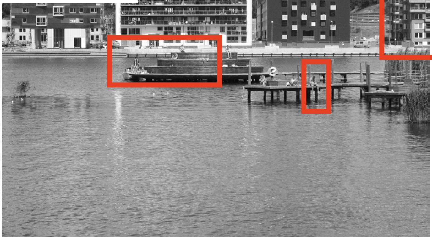
Hammarby Sjöstad, Stockholm

BAUKULTUR_IM_DIALOG IN BERLIN MITTWOCH 13. NOVEMBER 2013