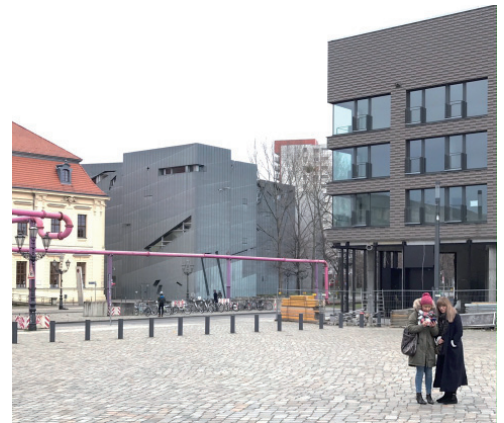
Blumenthal Akademie - Wohnen am Jüdischen Museum