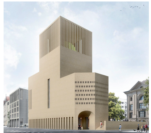
House of One