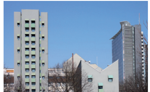
Gebäude der IBA 84-87 (John Heyduk) und GSW-Hochhaus