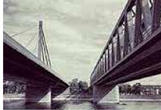
1 | Preisträger Bildnachweis

Ehrung, Landschaftsarchitektur alle zwei Jahre, international Bayerische Akademie der Schönen Künste Abteilung Bildende Kunst