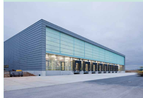
Walter Knoll Produktionsgebäude in Mötzingen. Architektur: HansUlrich Benz.

Wir engagieren uns für die Bundesstiftung Baukultur als Mitglied im Förderverein, weil... „Architekten für Walter Knoll wichtige Partner sind für die Realisierung von Projekten weltweit.“