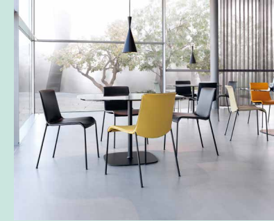
Liz. Design: Claudio Bellini.

Wir engagieren uns für die Bundesstiftung Baukultur als Mitglied im Förderverein, weil... „Architekten für Walter Knoll wichtige Partner sind für die Realisierung von Projekten weltweit.“